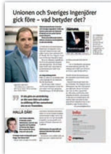
Ur Info 12/2010

HÅLL IHOP. Att avtalen löper ut olika tider gör det svårare för facken att hålla ihop.