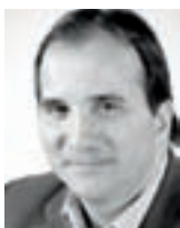
Stefan Löfven Förbundsordförande i IF Metall

Den borgerliga politiken straffar dem som redan drabbats av sjuk- dom eller arbetslöshet. Vår ideolo- giska linje är i stället att kampen för ett friskare arbetsliv och mot arbetslöshet är investeringar som är lönsamma både ekonomiskt och inte minst mänskligt!