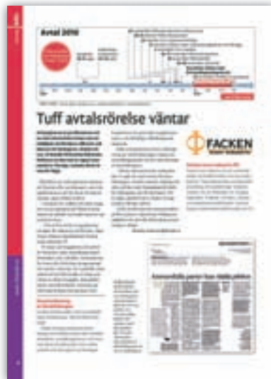
Ur Info 4/2009