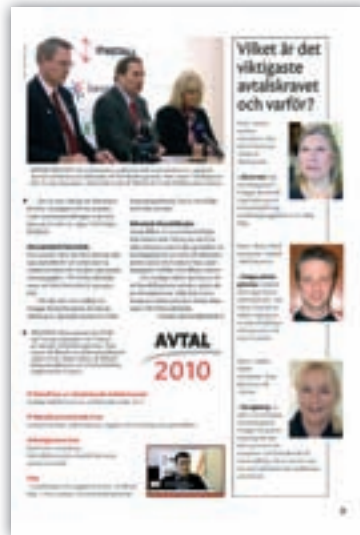
Ur Info 3/2010